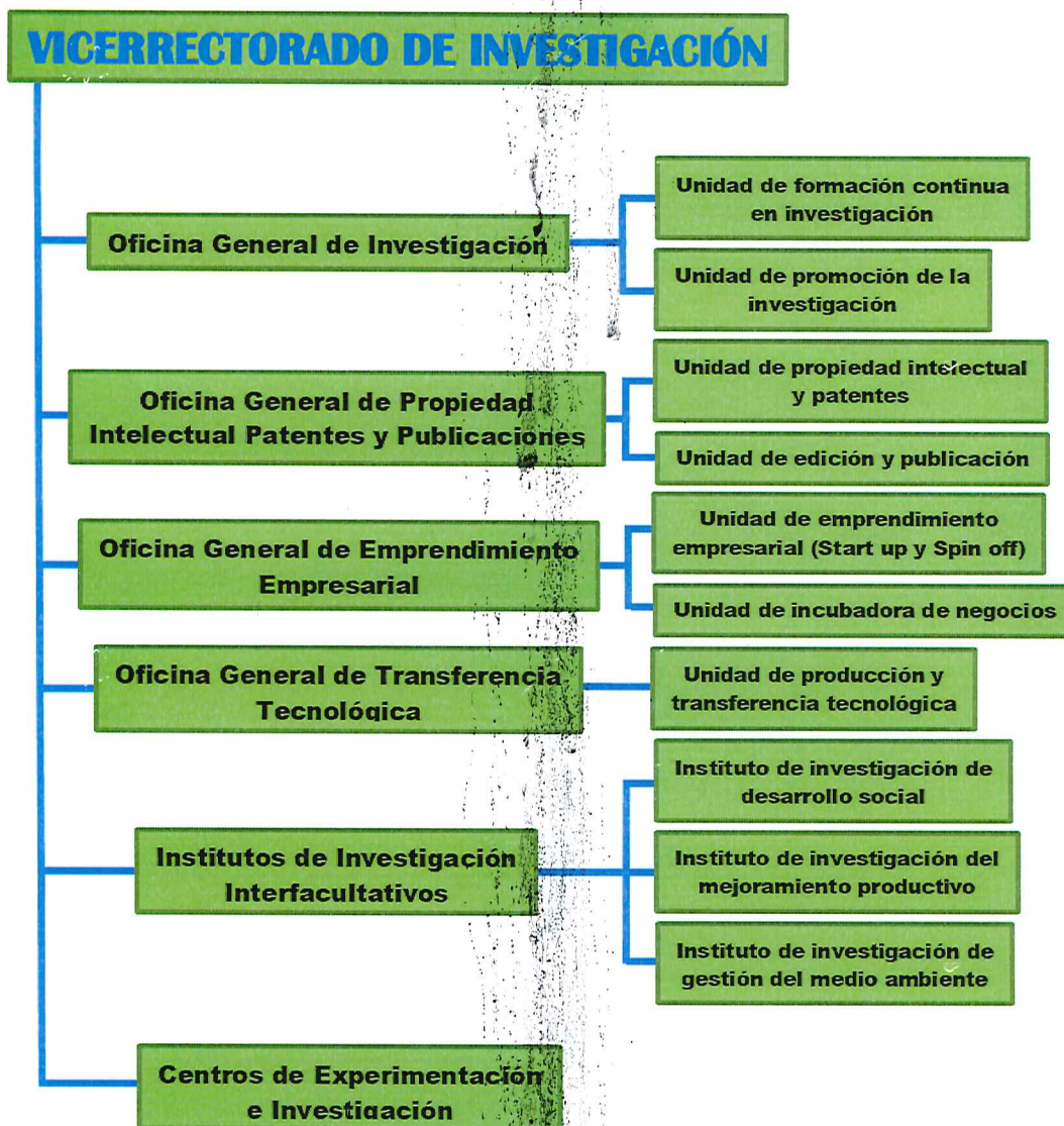
Organigrama de la Vicepresidencia de Investigación