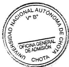
Yoel Saavedra Nauca